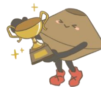
大会公式キャラクター：たまくん®